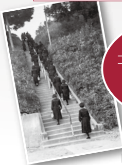
階段を上る生徒たち