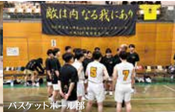
バスケットボール部