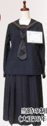
当時の制服 (大正15年~)