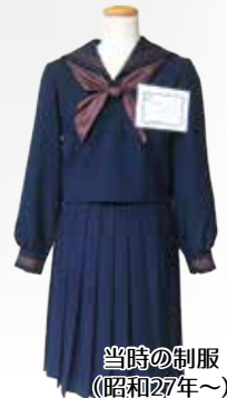
当時の制服 (昭和27年~)